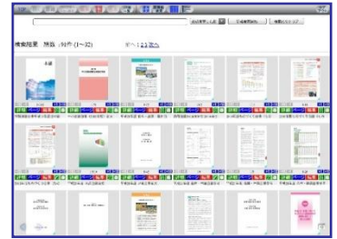
検索画面イメージ